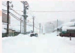
雪に埋もれる幹線道路の車

1月7日から降り続いた記録的大雪は、福井市では10日に積雪107センチを記録いたしました。14日になっても市内全域の除雪は行き届かず、住民生活に大きな混乱を引き起こしました。今後、皆様からのご意見などをまとめ、3月議会などでしっかりと対策を講じる為の議論をいたします。ご意見をお待ちしております。