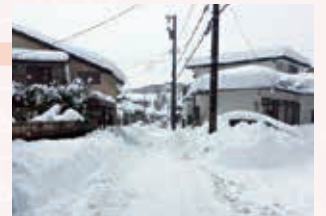
除雪車が通るが、圧雪が残る生活道路