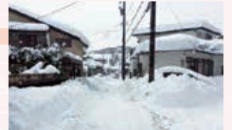
除雪車が通るが、圧雪が残る生活道路