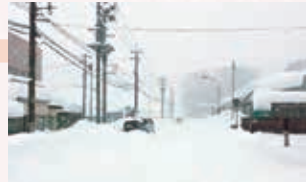
雪に埋もれる幹線道路の車

1月7日から降り続いた記録的大雪は、福井市では10日に積雪107センチを記録いたしました。14日になっても市内全域の除雪は行き届かず、住民生活に大きな混乱を引き起こしました。今後、皆様からのご意見などをまとめ、3月議会などでしっかりと対策を講じる為の議論をいたします。ご意見をお待ちしております。