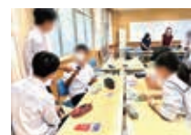
福井丸岡高校の授業にてSDGsカードゲームをしました。