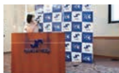
福井商工会議所青年部様にSDGs研修の講師をしました。